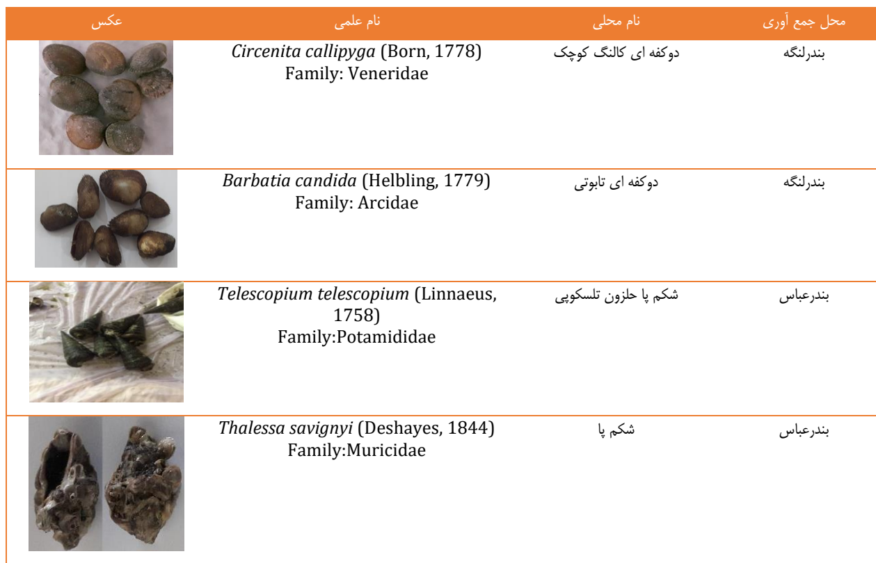
جدول ۲) مشخصات نرم تنان مورد بررسی در مطالعه حاضر