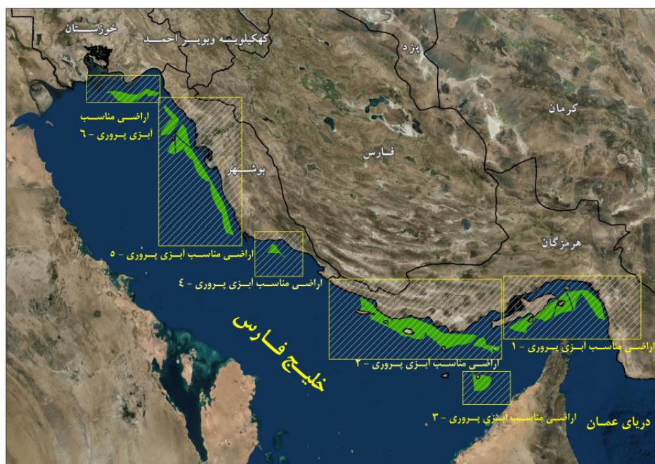
شکل ۲. نقشه پراکنش نقاط مناسب برای پرورش ماهی در قفس در خلیج فارس