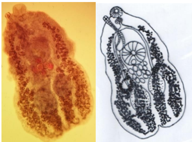
شکل شماره ۲: تصویر و شکل انگل Lepocreadioides zebrani شناسایی شده در این مطالعه