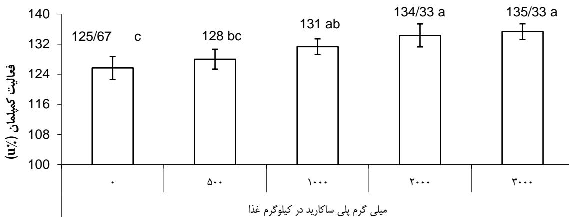
شکل ۳. میزان فعالیت همولیتیک کمپلمان ماهی قزل آلابی رنگین کمان تحت تأثیر افزودنی غذایی پلی ساکارید؛ داده‌ها به صورت میانگین \pm سه تکرار بیان شده‌اند. حروف متفاوت نشان دهنده تفاوت معنی‌دار بین میانگین‌ها است ( P < 0.05 ).