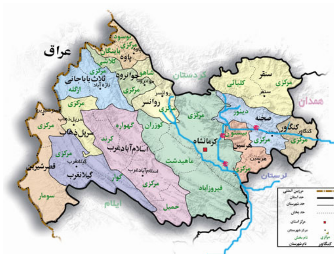
شکل ۱ مسیر رودخانه گاماسیاب در محدوده استان کرمانشاه

داده‌ها به صورت میانگین ± انحراف معیار می‌باشند.