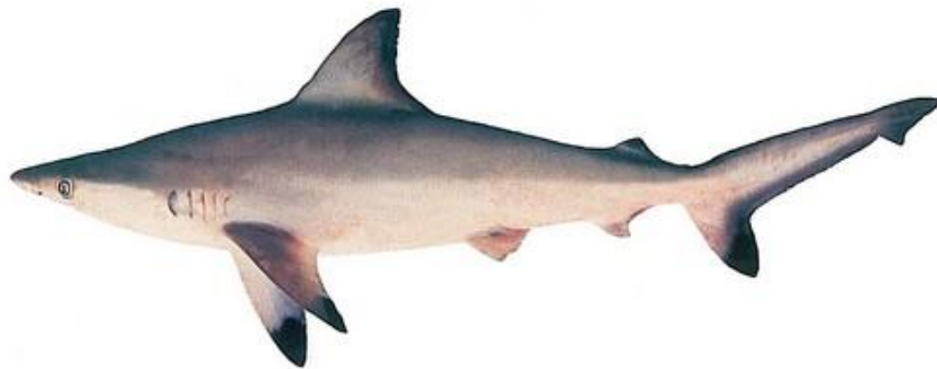
شکل ۱. کوسه دم خالدار خلیج فارس ( Carcharhinus sorrah (Müller & Henle, 1839)

کوسه مورد بررسی در مطالعه حاضر، کوسه دم خالدار خلیج فارس ( Carcharhinus sorrah (Müller & Henle, 1839) از خانواده Carcharhinidae می‌باشد (شکل ۱). این خانواده با داشتن ۱۲ جنس و ۴۸ گونه سومین خانواده از لحاظ تنوع گونه ای به حساب آمده و در مناطق گرمسیری از لحاظ تنوع گونه ای، فراوانی و مقدار توده زنده، غالب می‌باشد. در این خانواده جنس Carcharhinus با داشتن ۲۹ گونه انتشار جهانی داشته و در آب های گرم و معتدله غالب هستند [۵]. در منطقه غرب اقیانوس هند، ۲۱ گونه از این جنس وجود دارد که ۱۳ گونه آن از خلیج فارس و دریای عمان گزارش شده است و در این بین، ۱۱ گونه مربوط به آب های استان هرمزگان می‌باشد. درداب و همکاران در سال ۱۴۰۰ اثر ضد باکتریایی فرکشن حاوی ترکیب اسکوالین از کبد کوسه دم خالدار خلیج فارس را بررسی نمودند. نتایج آن مطالعه بیانگر حضور اسکوالین در کبد کوسه ماهی مورد مطالعه و خواص ضد باکتریایی آن در مهار رشد برخی سویه های باکتری‌های گرم منفی و گرم مثبت بود [۶]. با توجه به صید ضمنی کوسه دم خالدار در کنار صید ماهیان تجاری خلیج فارس و تلف شدن تعداد زیادی از نمونه‌ها در حین صید، هدف مطالعه حاضر استخراج ترکیبات استروئیدی و اسید چرب ذخیره شده در کبد کوسه C. sorrah از خلیج فارس و ارزیابی فعالیت ضد قارچی آن در نظر گرفته شد.