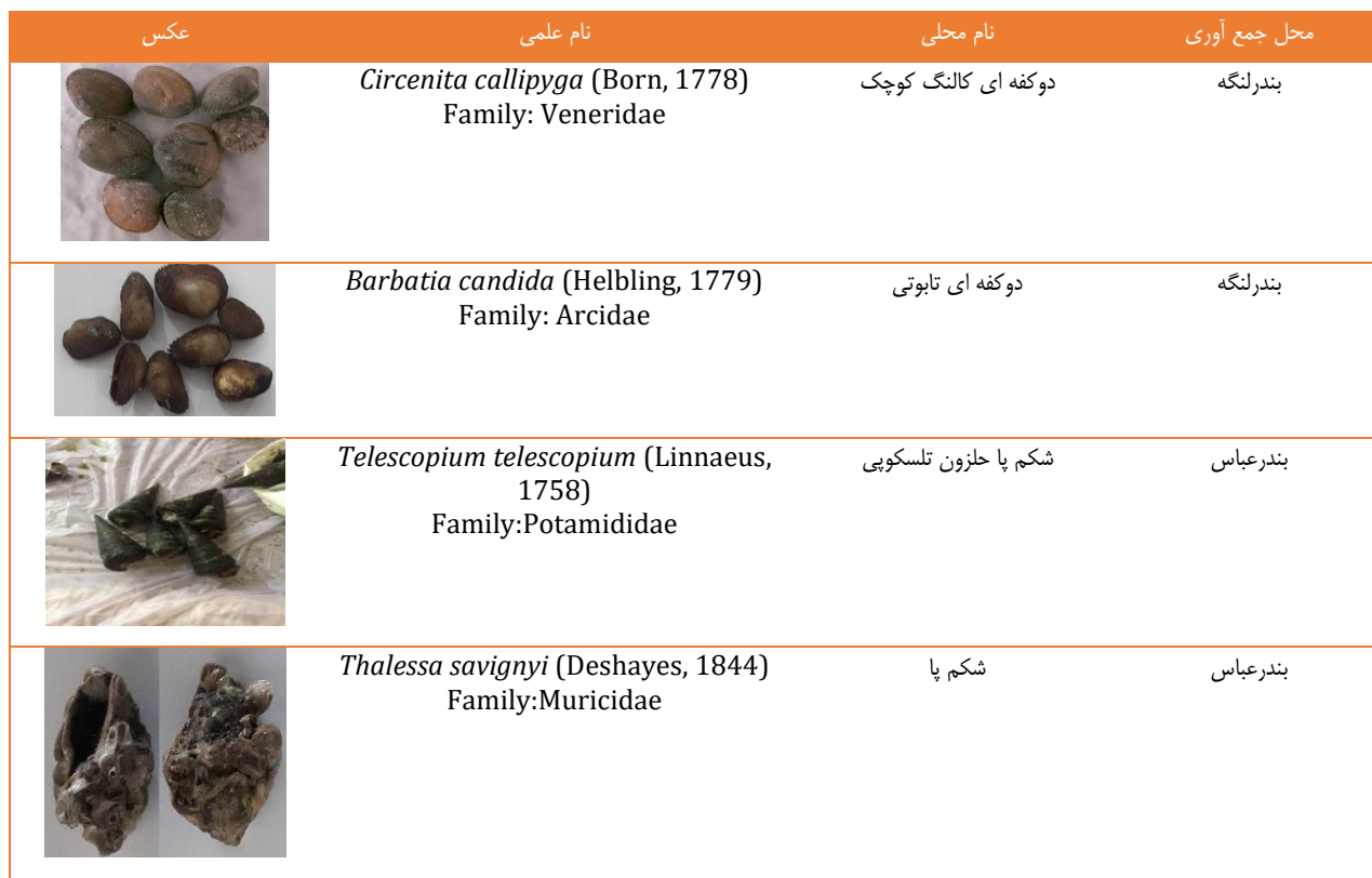
جدول ۲) مشخصات نرم تنان مورد بررسی در مطالعه حاضر