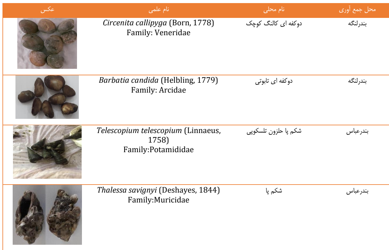
جدول ۲) مشخصات نرم تنان مورد بررسی در مطالعه حاضر