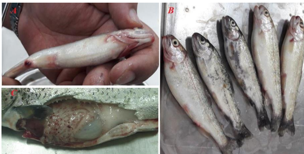
شکل ۱- یافته‌های معاینه درمانگاهی و کالبدگشایی ماهیان تلقیح شده با Y. ruckeri ؛ تصویر (A) همورازی و زخم در مخرج و فک زیرین، (B) سیاه شدگی جزئی و خونریزی سرسوزنی اطراف باله سینه‌ای، (C) خون‌ریزی سرسوزنی روی پیلوریک سکا