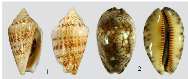
شکل ۱۱ Conomurex persicus (۱) و Mauritia grayana (۲)

دندان (۲M)+(L۱)+R+(۱L)+(۲M) بود که شامل یک دندان مرکزی (R)، یک دندان جانبی (L)، که معمولاً به سمت دندان مرکزی خمیده شده‌اند، و دو دندان حاشیه‌ای (M) است. شکل و اندازه رادولا و دندان‌های تشکیل‌دهنده آن در دو گونه کاملاً متفاوت از یکدیگر بوده و تعداد معینی برآمدگی کوچک در لبه خود دارند.