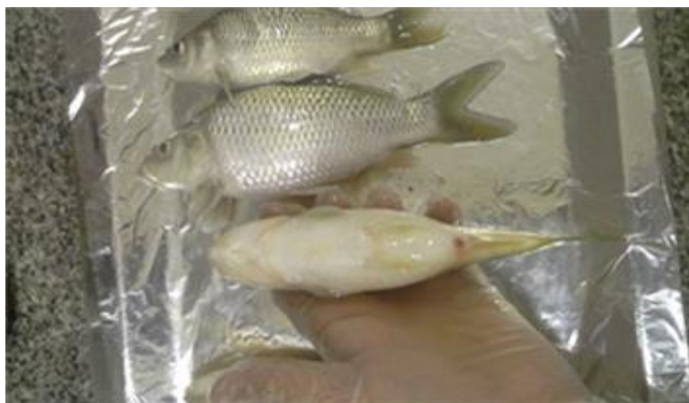
شکل ۳- علائم ماهیان بیمار شامل برآمدگی شکم و قرمزی مخرج

بر اساس این نتایج از روز اول پس از مواجهه علائم بیماری مشاهده شد. عمده علائم ماهیان بیمار شامل برآمدگی شکم و قرمزی مخرج آسیت و پرخونی اندام‌های داخلی ثبت گردید (شکل ۳). نتایج تلفات تجمعی نشان دادند که اختلاف معنی داری بین تیمارهای ۰.۸٪ و ۱٪ درصد کور کومین با تیمارهای کنترل، ۰.۲٪، ۰.۴٪، ۰.۶٪ وجود دارد ( p < 0.05 ) (شکل ۲).