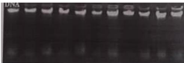
شکل ۱. کیفیت DNA استخراج شده بر روی ژل آگارز ۱٪