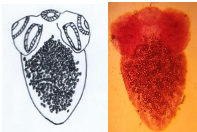
شکل شماره ۳: تصویر و شکل انگل Scolex pleuronectis شناسایی شده در این مطالعه

مشخصات سستود مذکور بشرح زیر بوده است. میانگین طول بدن: ۴۸۹ میکرون، میانگین عرض بدن: ۳۱۵ میکرون، میانگین اندازه تخم: ۲۹،۵۲ در ۱۷،۱۲، میانگین اندازه بادکش ها: ۱۴۴ میکرون (شکل شماره ۳).