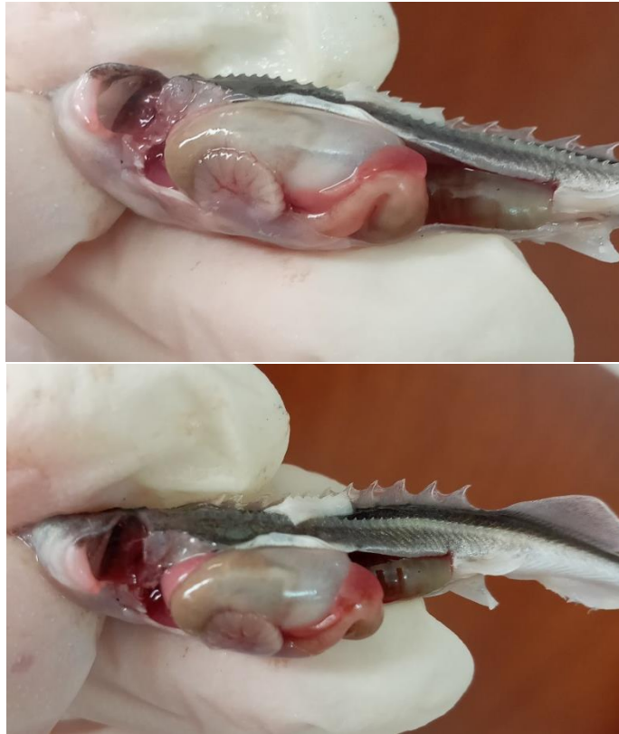
شکل ۱. کبد و طحال رنگ پریده به‌علاوه‌ی وجود غذای هضم نشده و زردآب در رودهی بچه‌ماهیان استرلیاد ( A. ruthenus ) پرورشی بیمار

آنچه از کشت بافت نمونه‌های بیمار بر محیط بلاد آگار مشاهده‌شد پرگنه‌های مدور، محدب با حاشیه‌ی صاف، سفید رنگ و موکوئید بودند (شکل ۲).