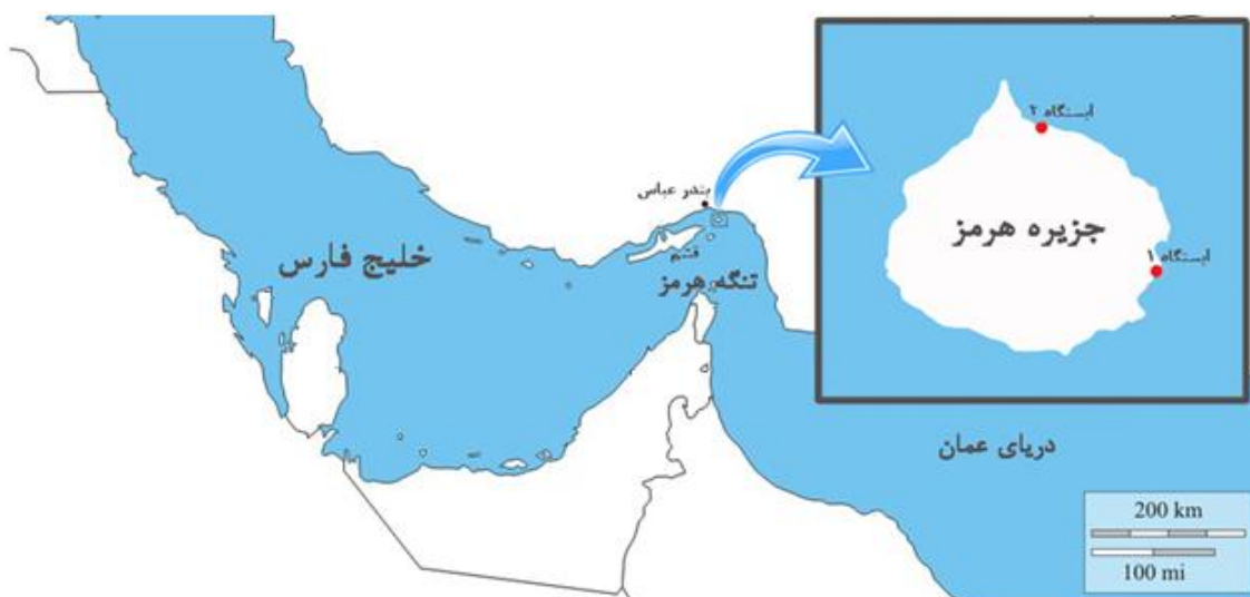
شکل ۱ موقعیت جغرافیایی ایستگاه‌های نمونه‌برداری در اطراف جزیره هرمز با بستر ماسه‌ای - سنگی (۱) و گلی - قلوه‌سنگی (۲).

جزیره هرمز انتخاب و مختصات هر منطقه با دستگاه GPS ثبت شد (شکل ۱). در هر ایستگاه کوادرات با ابعاد 50 \times 50 سانتی‌متر به‌صورت تصادفی و با ۴۰ بار تکرار، در مناطق دارای پوشش زوانتید و جلبک قرار داده شد و عکس‌برداری گردید (شکل ۲). از نرم‌افزار CPCe برای محاسبه درصد پوشش گونه مرجان نرم، گونه جلبک و فضای خالی مورد نظر استفاده شد. همچنین سایر عوامل محیطی در دو ایستگاه شامل شوری، دما، pH، اکسیژن