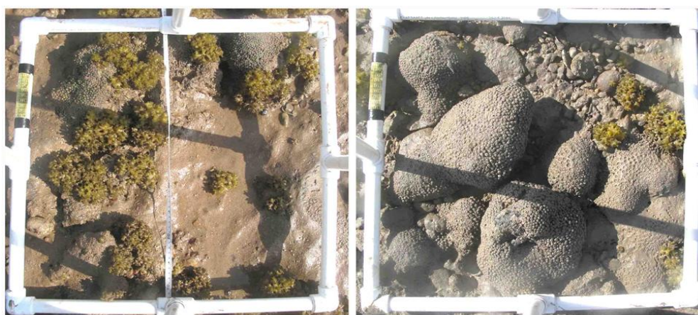
شکل ۲ کوادرات‌های عکس‌برداری شده از بستر گلی - قلوه‌سنگی (راست) و بستر ماسه‌ای - سنگی (چپ).