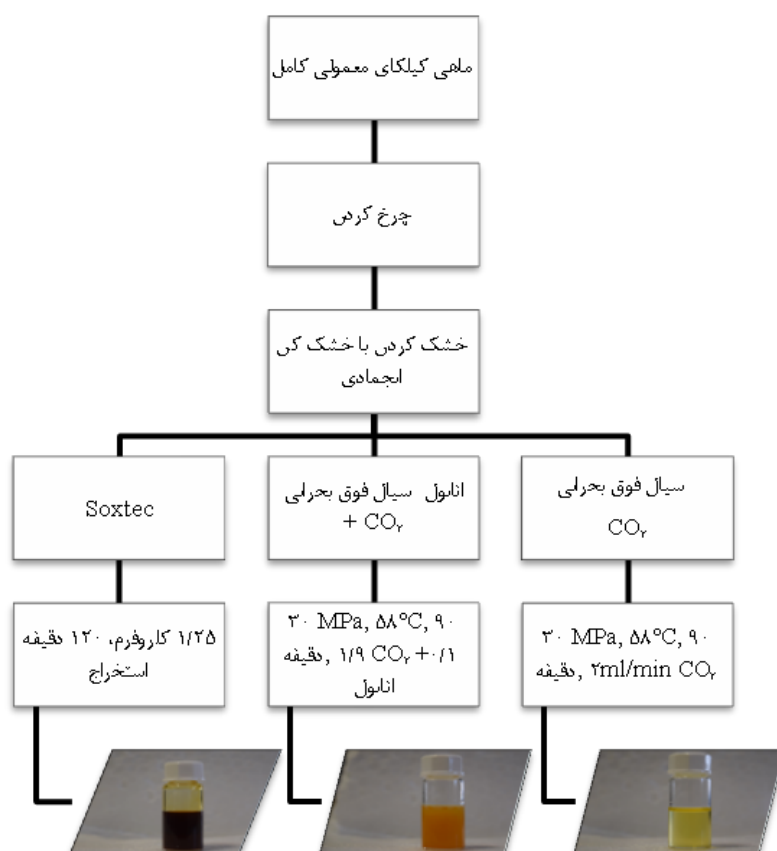
شکل ۲ نمودار فرایند استخراج

بود. بنابراین با توجه به سنجش میزان رطوبت ( 0/71 \pm ) 71/44 درصد) مقدار چربی کل براساس وزن مرطوب ( 9/57 \pm 0/04 ) خواهد بود. نتایج استخراج با سیال فوق بحرانی CO_2 و اصلاحگر اتانول در فشار 30 MPa، دمای 58^\circ C و سرعت جریان 2 ml/min نشان داد بازدهی استخراج با روش سیال فوق بحرانی CO_2 و اتانول به طور معناداری بالاتر از روش سیال فوق بحرانی CO_2 است (جدول ۱).